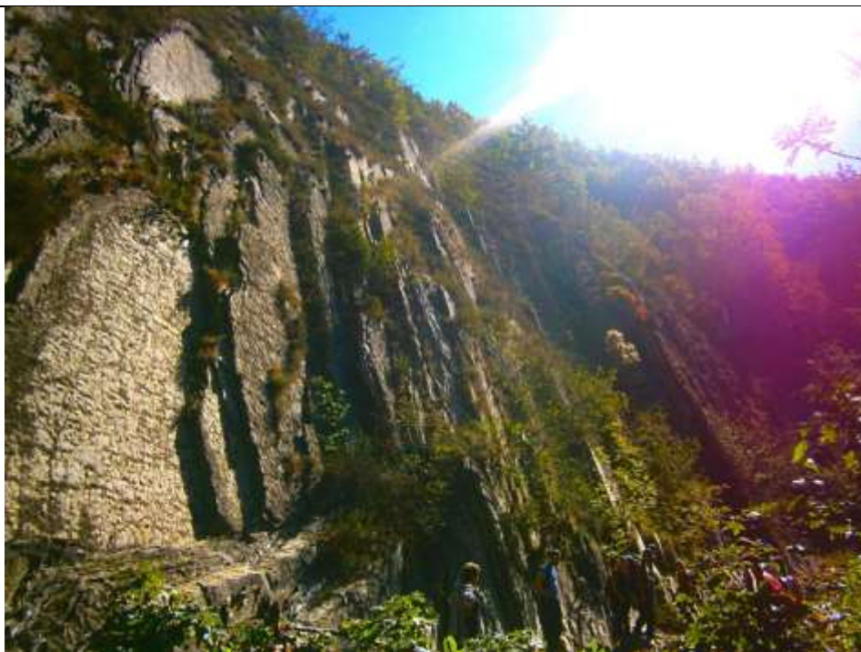
Скала Зеркало (лето)