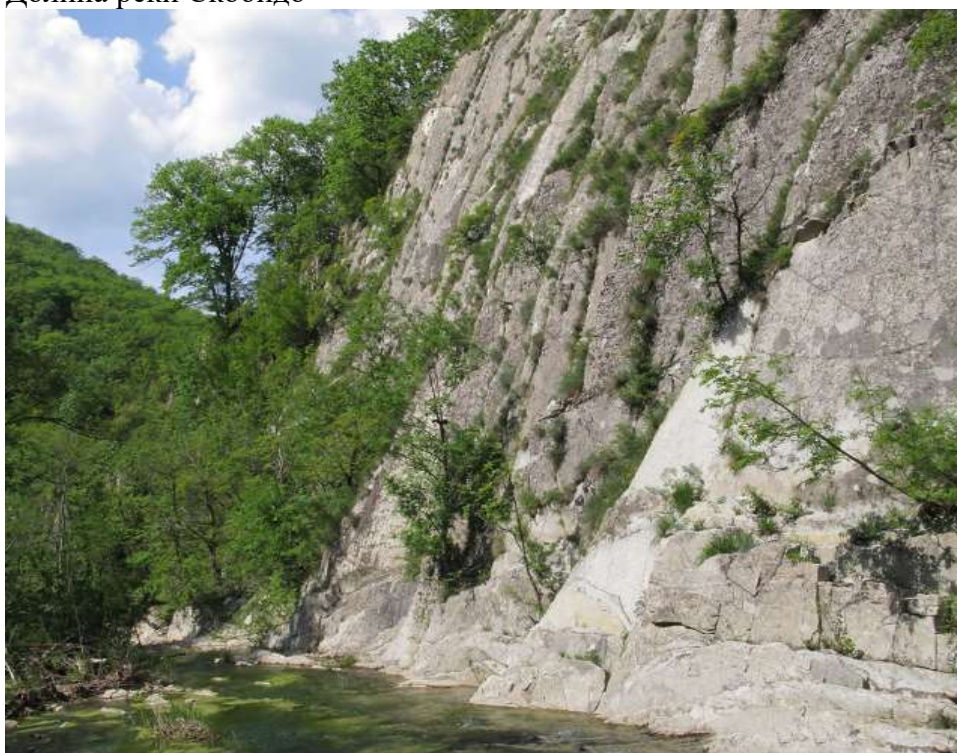
Скала Зеркало (лето)