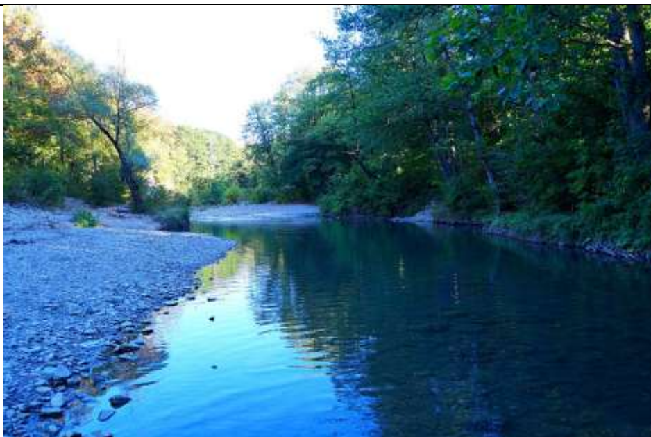
Долина реки Скобидо