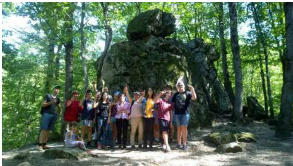
Скала «Чёртов палец»