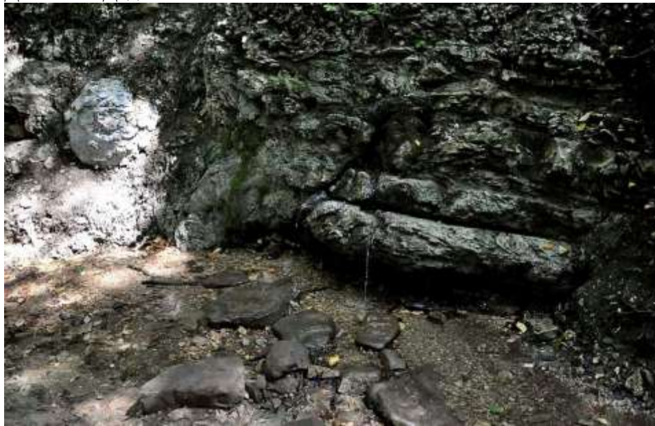
Источник «Живая и мёртвая вода»