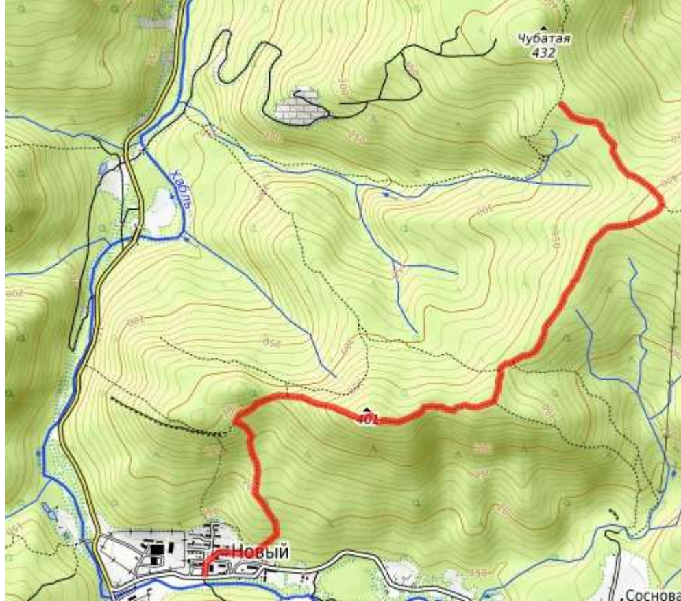
Красная нитка – пешая часть маршрута от п.Нового к каменным грибам