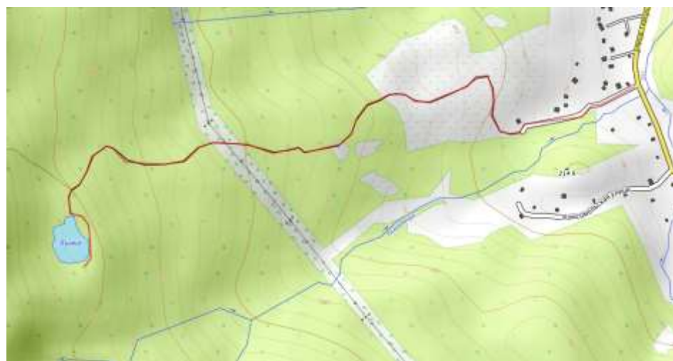
Пешеходная часть маршрута.