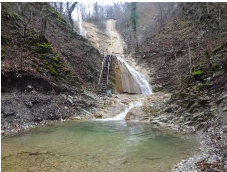
Водопад Белые скалы