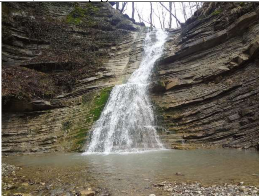
Водопад Фата невесты