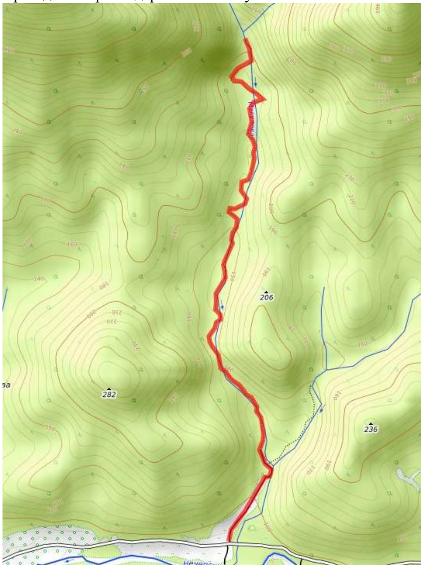
Пешеходная часть маршрута.