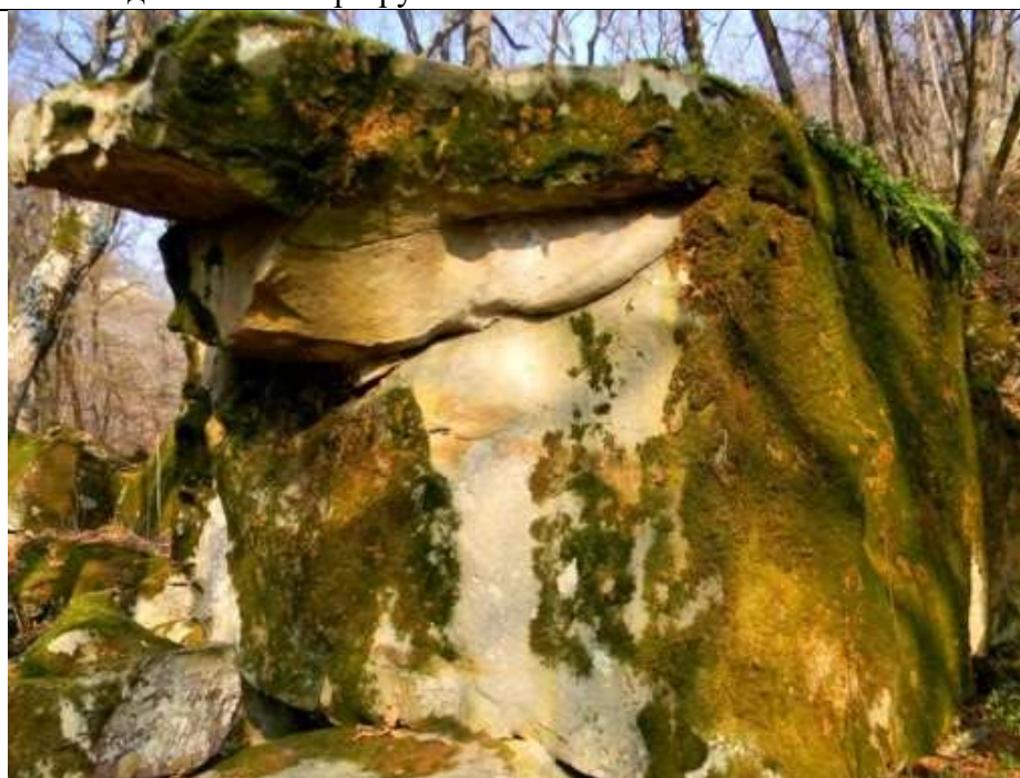
Достопримечательности рядом с Красными скалами