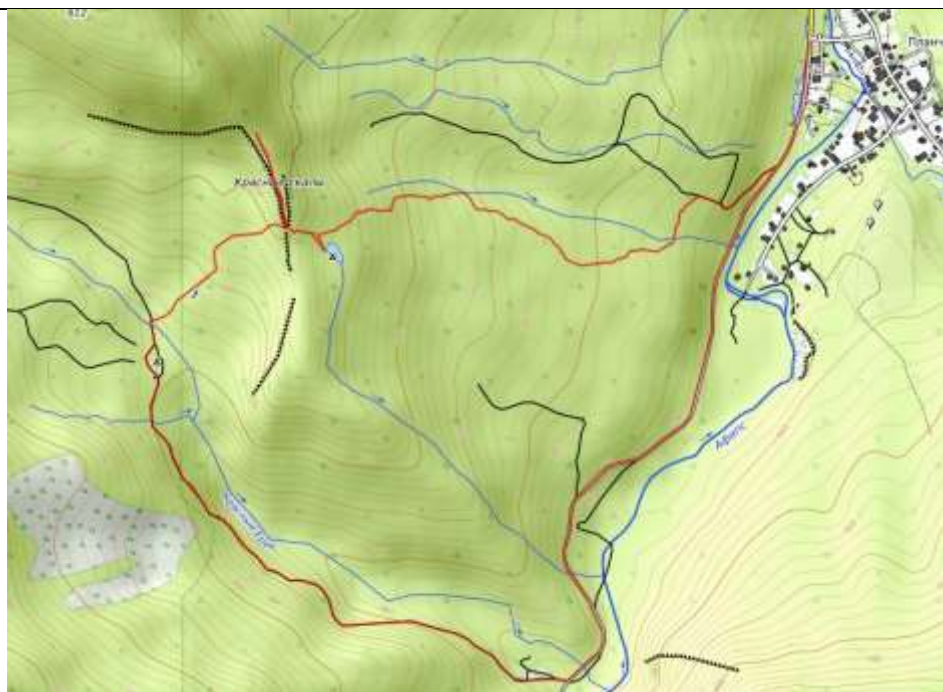
Пешеходная часть маршрута.