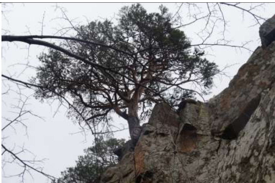
Красные скалы, вид снизу