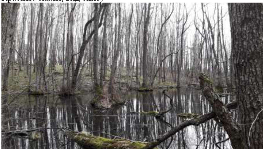
Озеро под Красными скалами