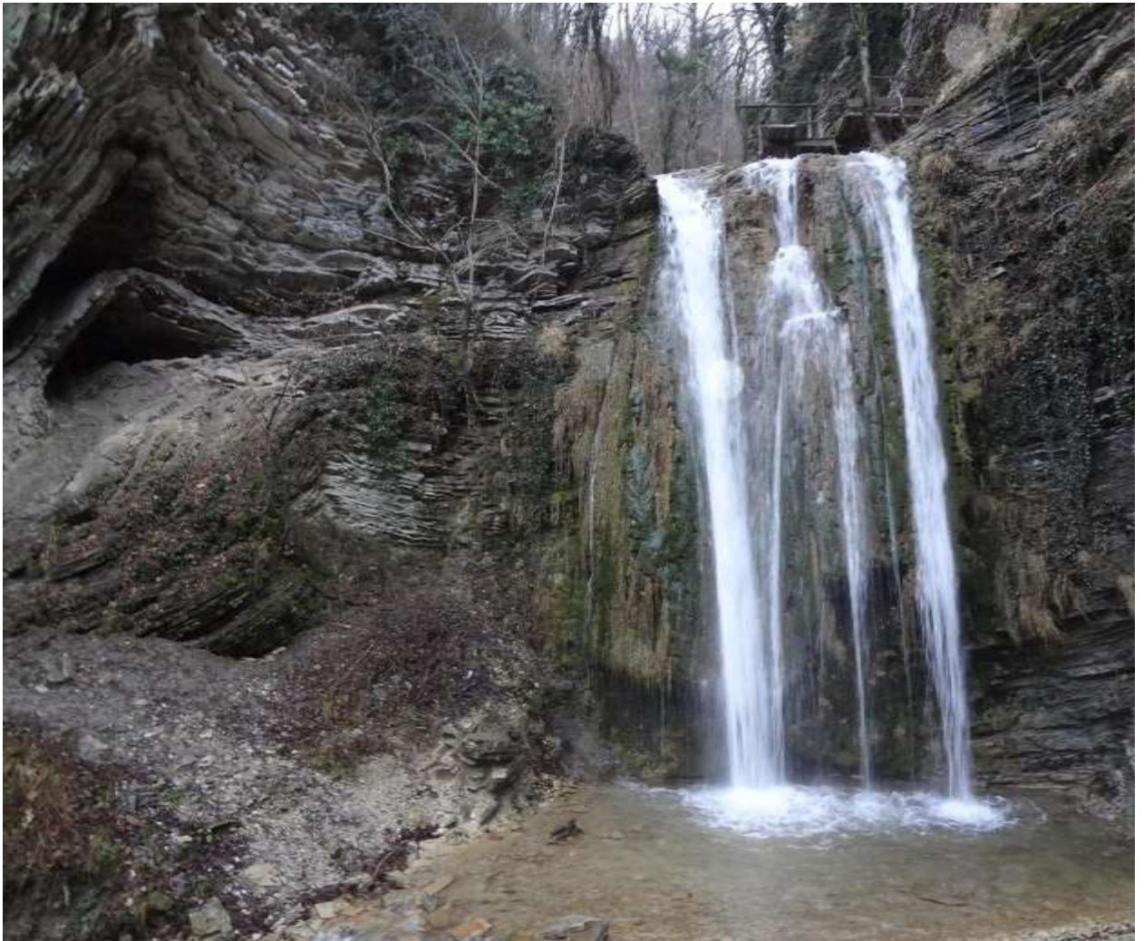
Тенгинские водопады (с.Тенгинка, д.р.Шапсухо)

Маршрут разработан методистом МБОУ ДО ЦДЮТ