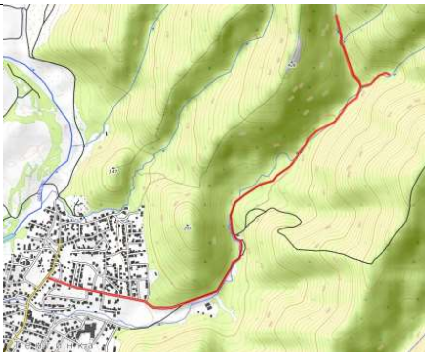
Пешеходная часть маршрута.