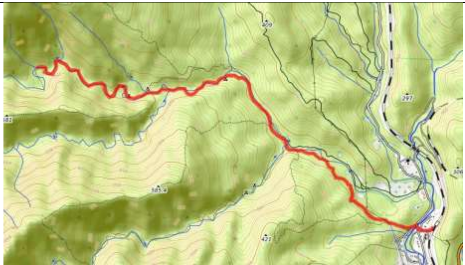
Пешеходная часть маршрута.