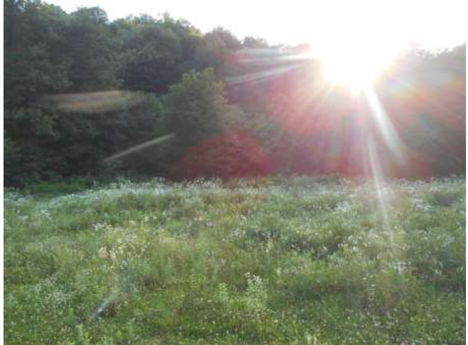
Поляна перед каньоном