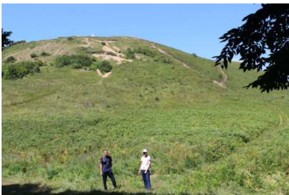
Выход из леса к вершине г.Семашхо