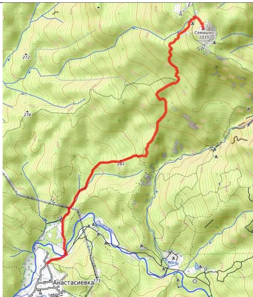
Пешеходная часть маршрута.