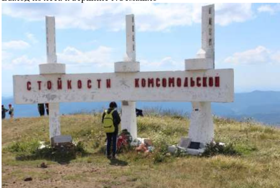
Памятник на вершине г.Семашхо