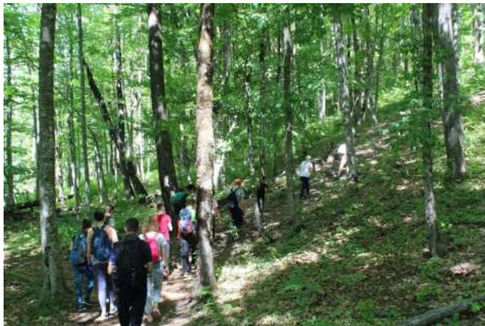
Путь через лес к г.Семашко