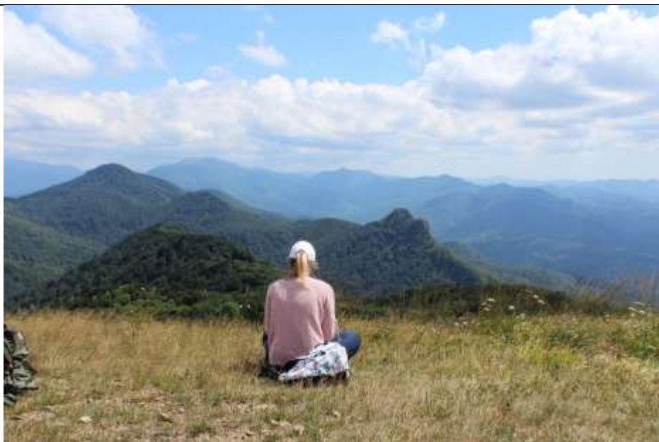
Вид с г.Семашхо