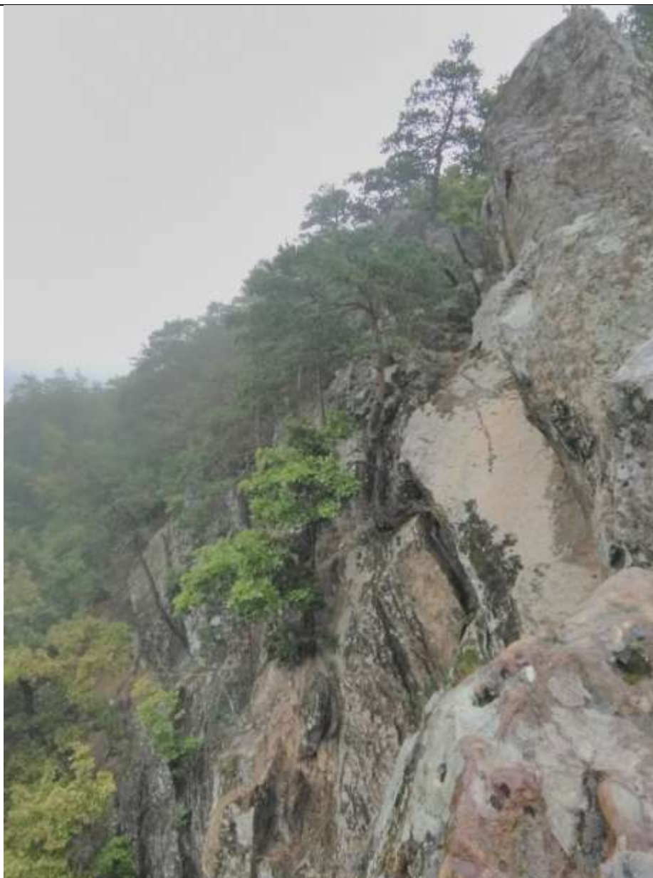
Планческие скалы вид сверху

К Планческим скалам можно подойти с разных сторон. Предложенный маршрут самый короткий и смотрбельный. Как только вы проедете т/б Крымская поляна первый заезд справа – это место начала пути. По хорошо натопанной тропе поднимаемся по выступающим скалам на самый верх, а потом спускаемся вниз, уходя под скалы и выходим на дорогу, чуть дальше места, где вы заходили в лес. Теперь мы двигаемся по течению реки орографически левым берегом по дороге пока не дойдём до места старта.