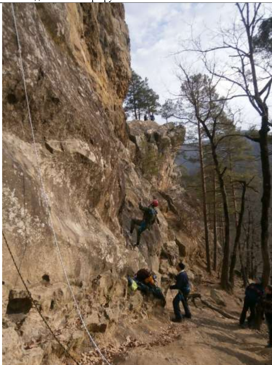
Планческие скалы вид снизу