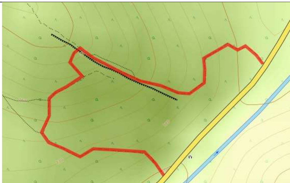
Пешеходная часть маршрута.