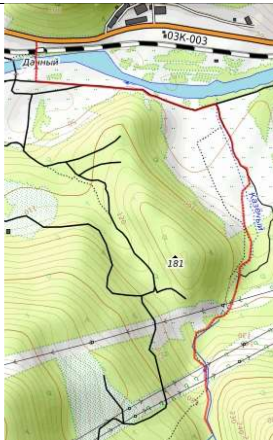
Пешеходная часть маршрута.