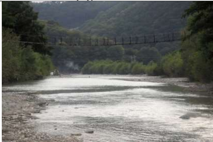
Мост через р.Туапсе