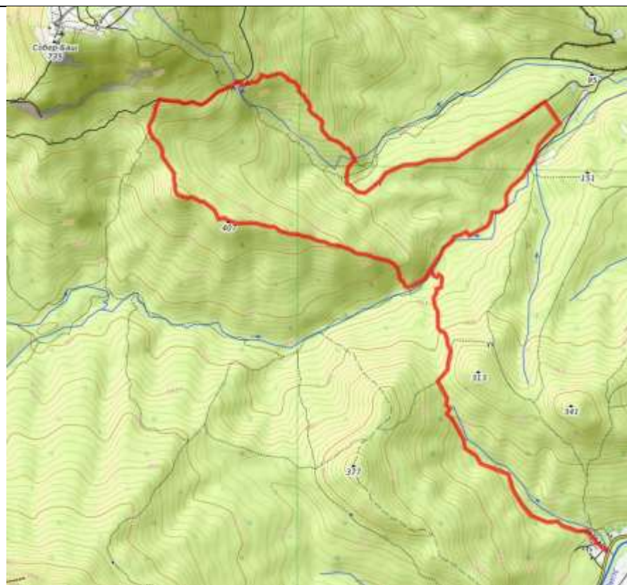
Пешеходная часть маршрута.