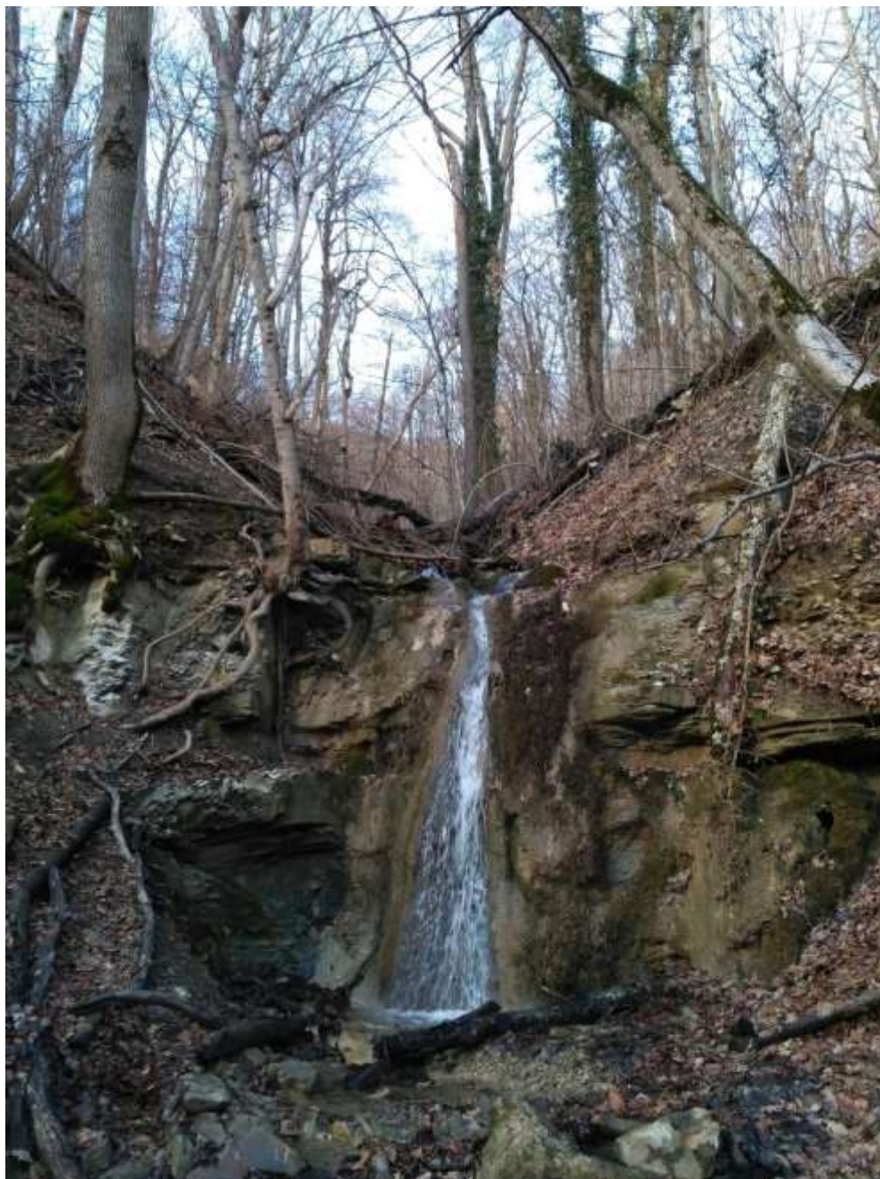
Водопад Мужские слёзы (д.р.Афипс, г.Собер баш)

Маршрут разработан методистом МБОУ ДО ЦДЮТ