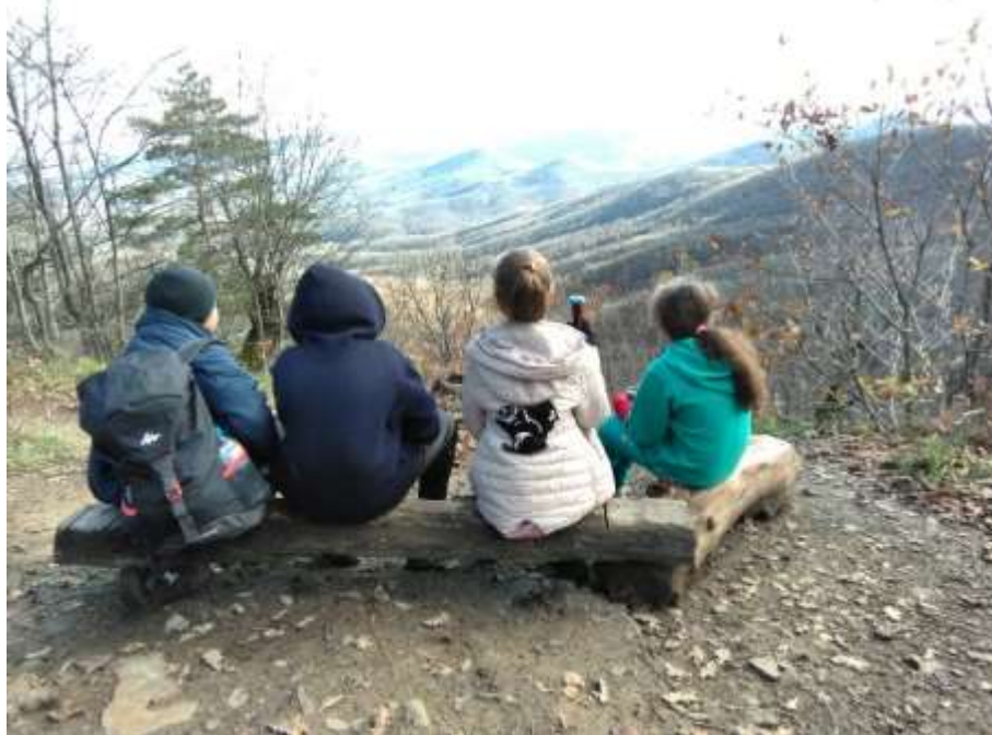
Смотровая площадка на д.р.Афипс

К водопадам тропа идёт от т/б Планческие скалы вдоль ерика, поднимается на водораздельный хребет и спускается в долину ручья Солёного к расположенным здесь столикам и лавочкам. Здесь можно пополнить запасы воды и отдохнуть. Далее, переходим ручей и выходим на старую грунтовую дорогу, поворачиваем влево, идём вверх по течению и через 150-200м. поворачиваем вправо и по маркированной тропе начинаем резкий подъём вверх по контрфорсу, здесь расположено много разбитых дольменных плит. Тропа постепенно выполаживается. После небольшого спуска вновь взлёт и выход на дорогу, которая у местных называется «Соберская кругосветка».