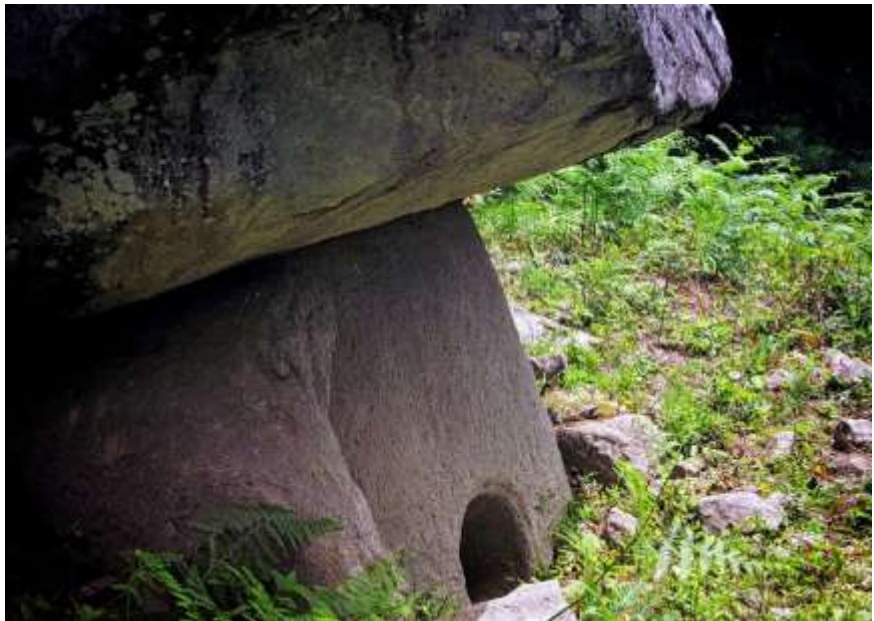
Дольмен на хребте Бзеульс