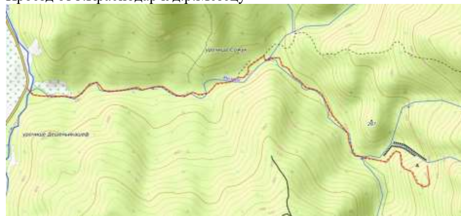
Пешеходная часть маршрута.