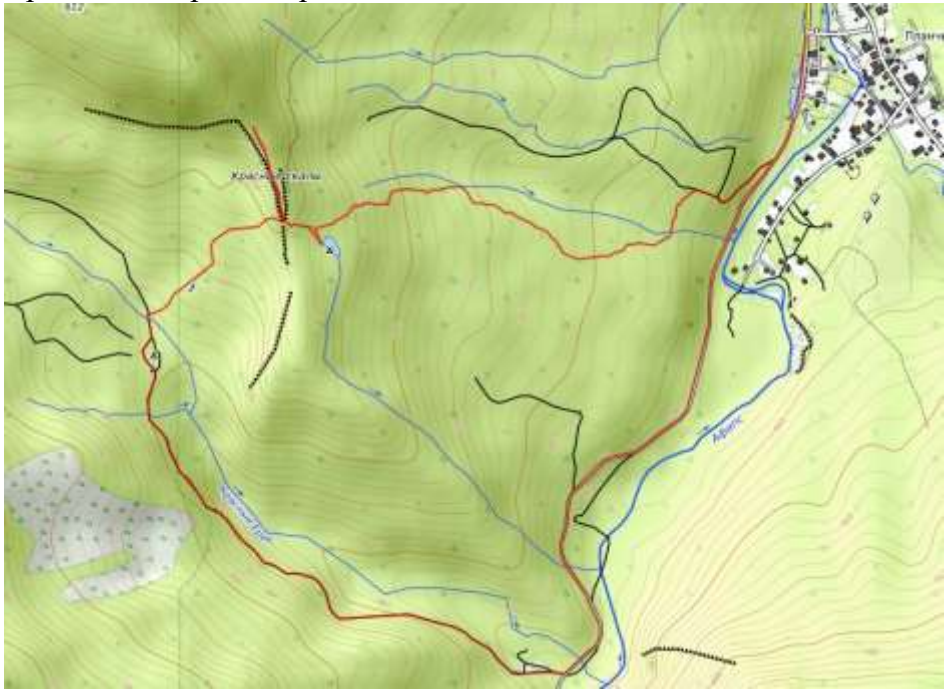
Пешеходная часть маршрута.