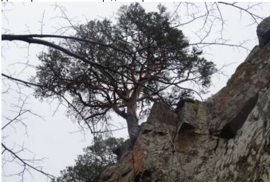
Красные скалы, вид снизу