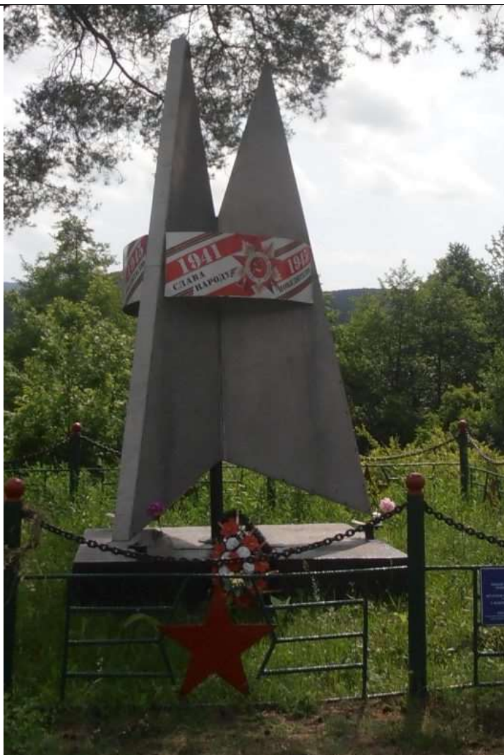
Памятник воинам 30й Иркутской дивизии, начало пешего маршрута