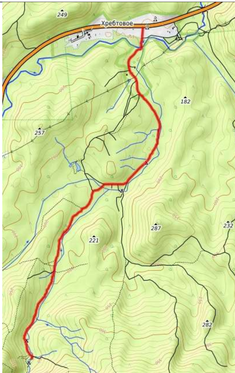
Пешеходная часть маршрута.