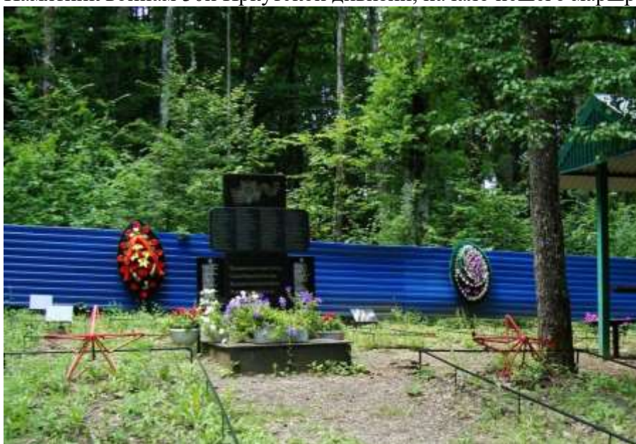
Мемориал воинам 30й Иркутской дивизии