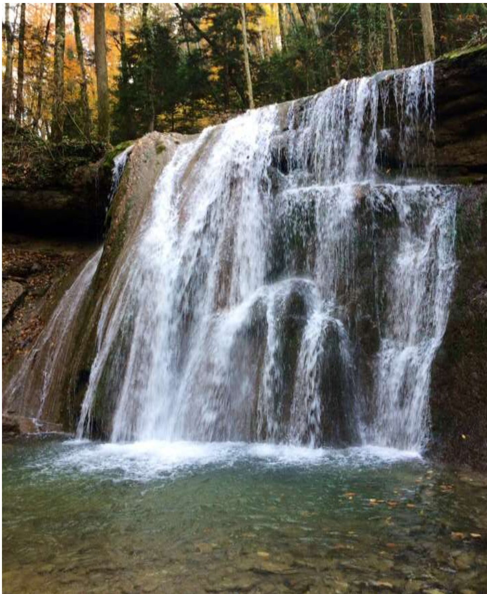
Каверзинские водопады (д.р. Тамбовская щель)

Маршрут разработан методистом МБОУ ДО ЦДЮТ