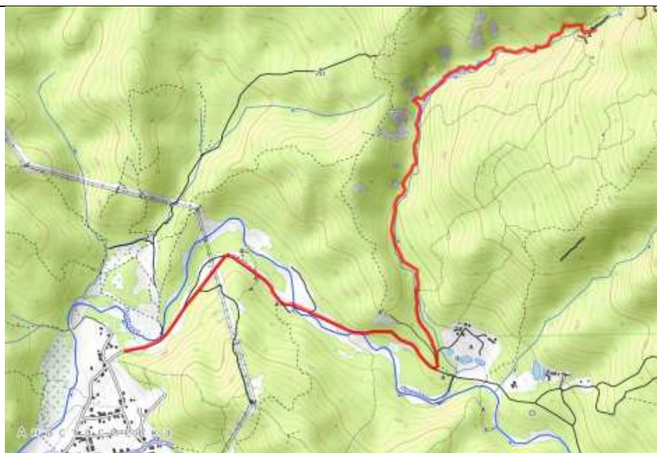
Пешеходная часть маршрута.