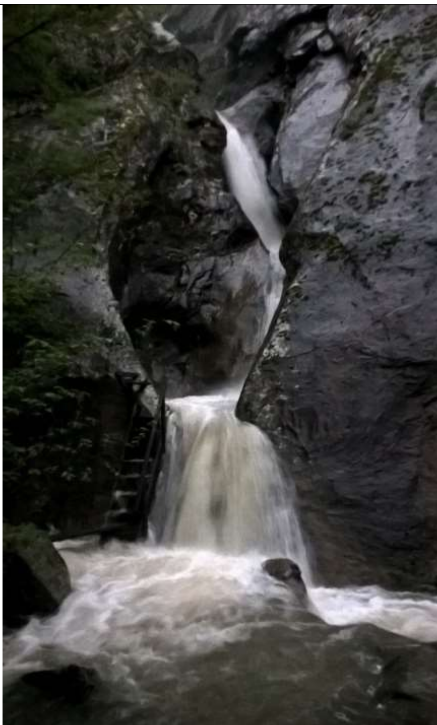
Водопад в каньоне

От села Анастасиевка, населенного в конце прошлого века переселенцами из Чехии, ваш путь лежит по долине реки Пшенаха, по проселочной дороге под старыми грушевыми деревьями.