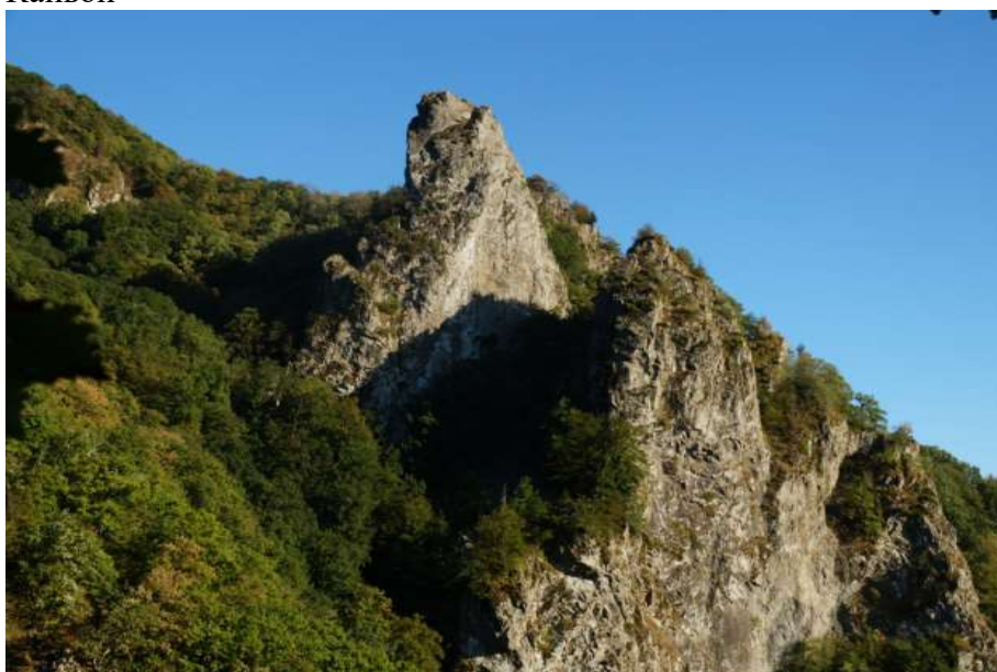
Вид из каньона