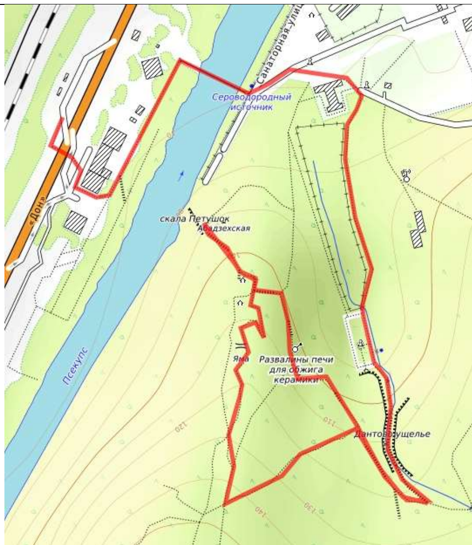
Пешеходная часть маршрута.