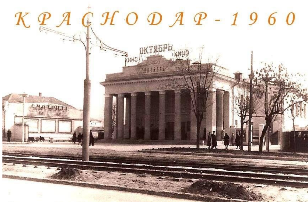
Кинотеатр "Октябрь" на ул. Карла Либкнехта.

К слову сказать, фильм снимался в Краснодаре. В начале 60-х годов в городе работало уже 9 зимних и 12 летних кинотеатров. Активно работали профсоюзные организации, все участвовали в социалистическом соревновании. Кинотеатры – были центрами культурно-просветительской жизни города: тематические показы фильмов, кино вечера, лектории, кино клубы, разъяснительная и агитационная работа и т.д.