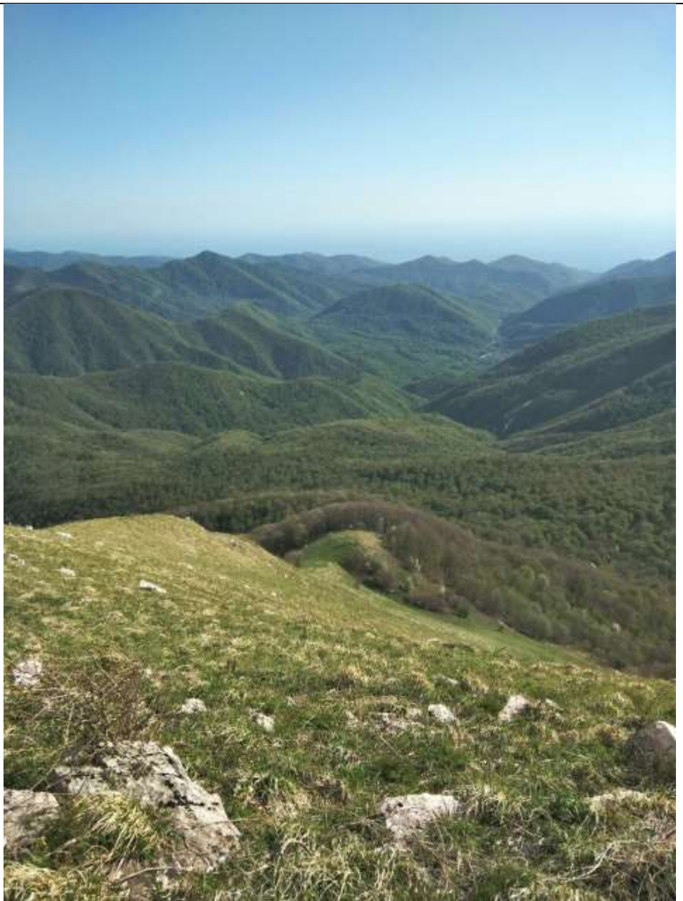
Вид с вершины