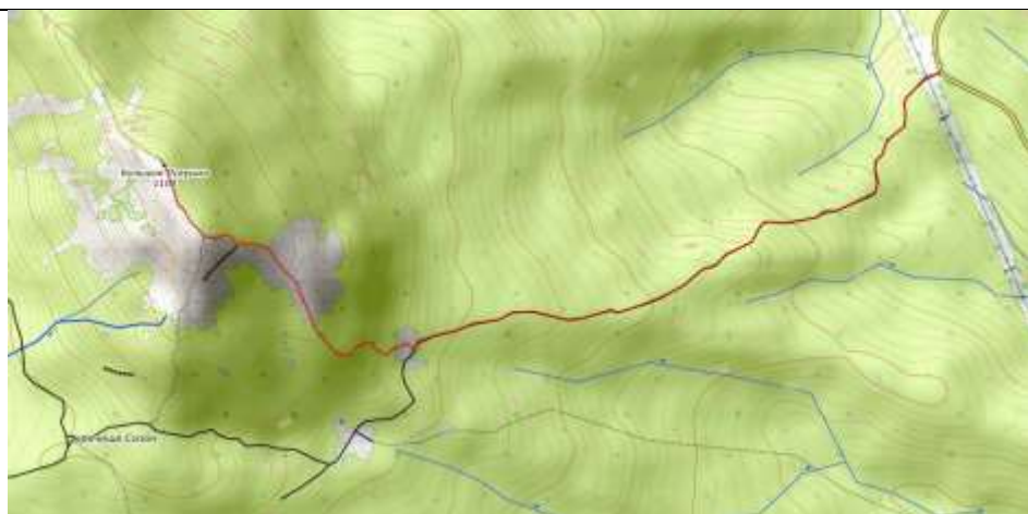
Пешеходная часть маршрута.