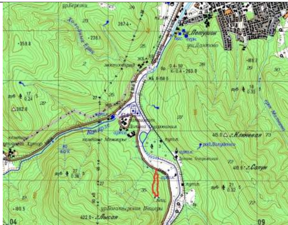
Красная нитка пешеходная часть маршрута.