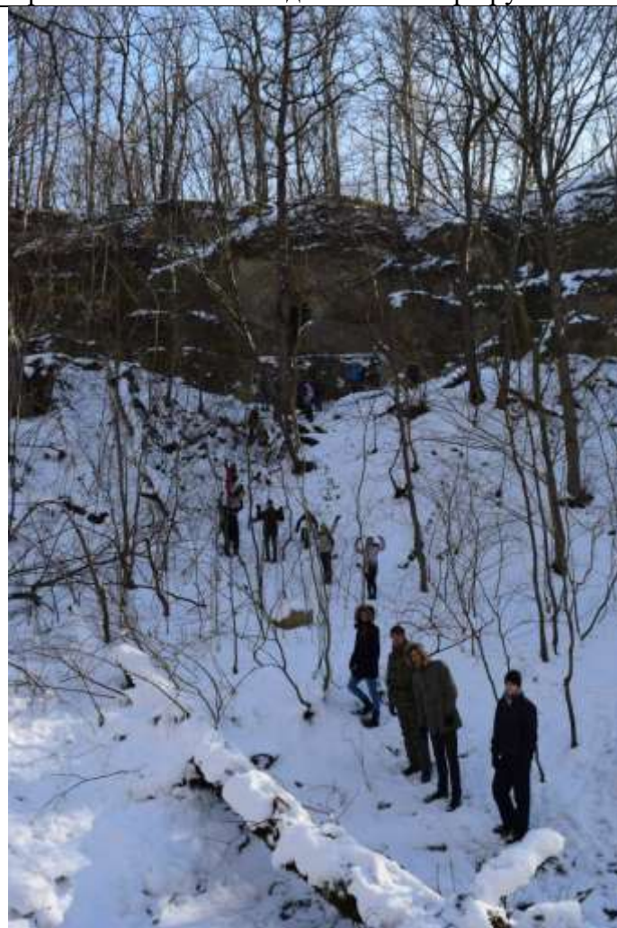
Подход к пещерам