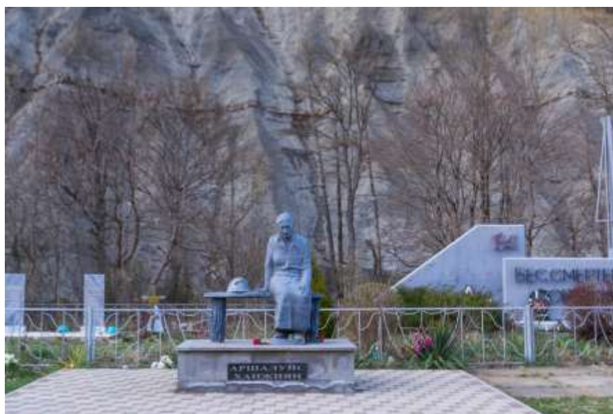
Мемориал в хуторе Поднависла