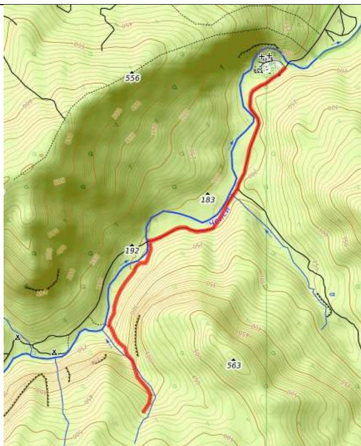
Красная нитка пешеходная часть маршрута.